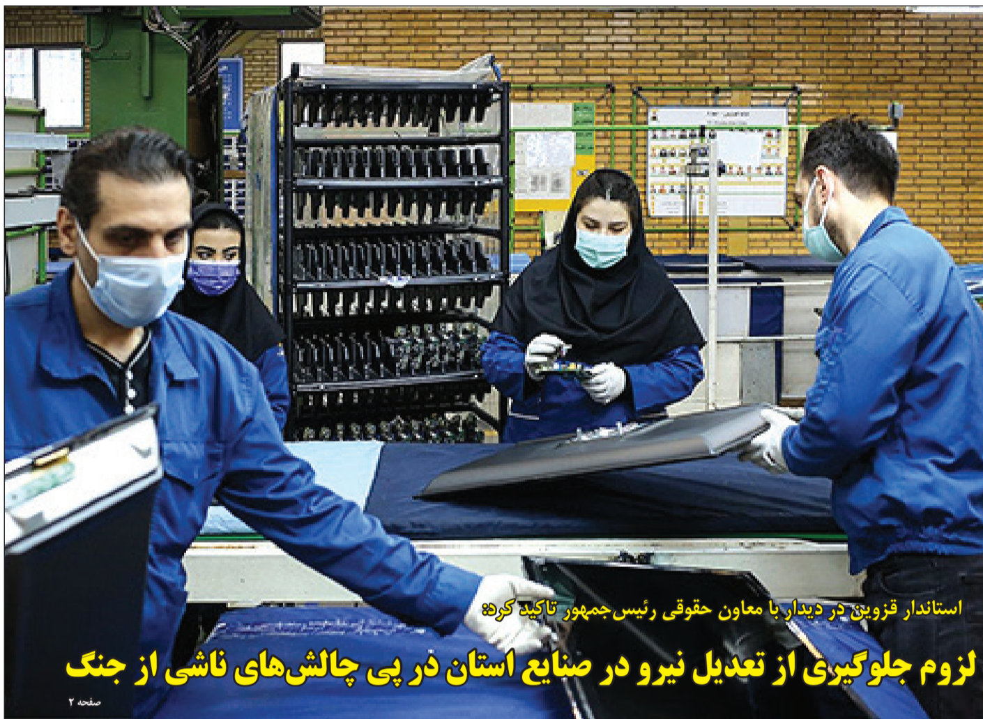
استاندار قزوین در دیدار با معاون حقوقی رئیس‌جمهور تأکید کرد: